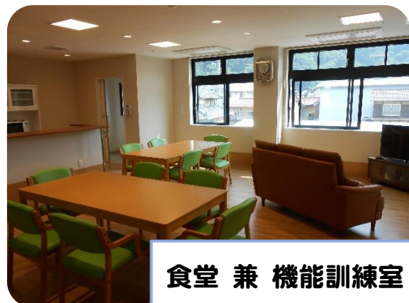
食堂 兼 機能訓練室